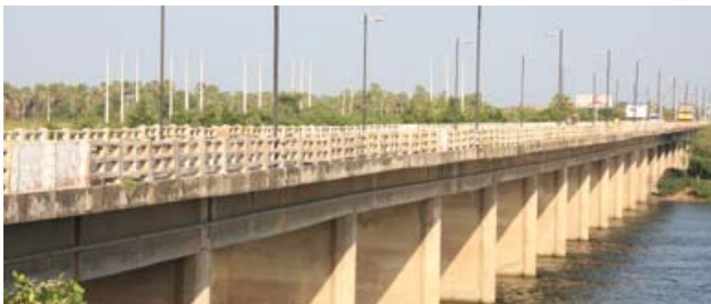
PONTE JUSCELINO KUBITSCHKE SOBRE O RIO JAGUARIBE, EM ARACATI, JÁ TEVE OBRAS DE DUPLICAÇÃO INICIADAS

F oram iniciadas este ano as obras de melhoramentos com adequação de capacidade – duplicação – da Ponte Juscelino Kubitschek sobre o rio Jaguaribe, também conhecida como Ponte de Aracati. Os contratos para as obras foram assinados no final de janeiro pelo Departamento Nacional de Infra-Estrutura de Transportes (Dnit). A nova ponte, orçada