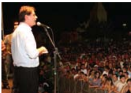
GOVERNADOR CID GOMES DISCURSA EM CASCAVEL

O deputado Dedé Teixeira (PT) tem consolidado nos últimos meses o seu trabalho de lutar por projetos e políticas públicas de desenvolvimento do Litoral Leste do Ceará. Em fevereiro, Dedé esteve, junto com o Governador Cid Gomes, nos municípios de Beberibe e Cascavel, no ato de assinatura das ordens de serviço para a duplicação da CE-040. Segundo o projeto, serão construídos mais 44,5 km, uma continuação da duplicação que foi realizada no trecho que leva até o município de Iguape, em Aquiraz. O evento aconteceu nos dois municípios, e contou com a presença de secretários de Estado e de deputados estaduais.